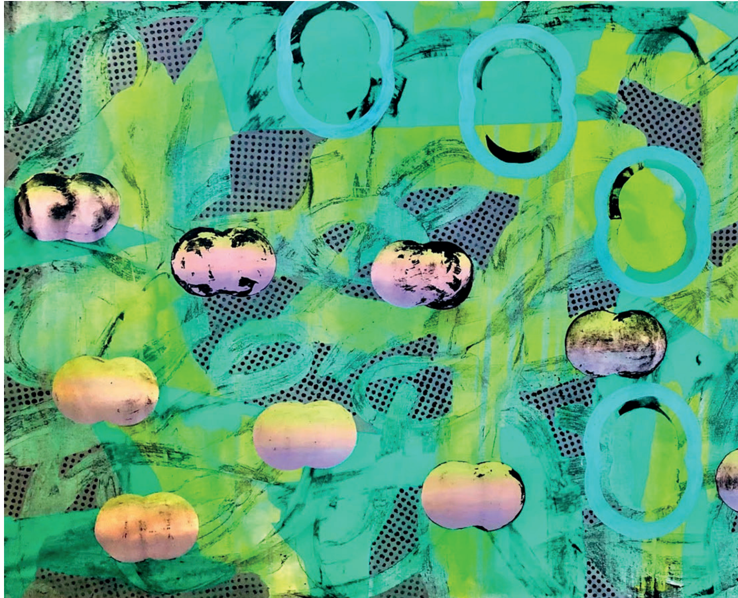
Título/ "Escafandra" Técnica mixta/ Óleo, pigmento acrílico. 130 X 260 cm 2022